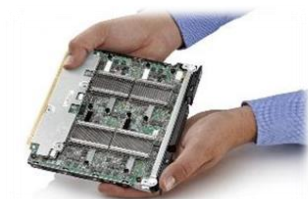
Hohe Dichte / wenig Energie