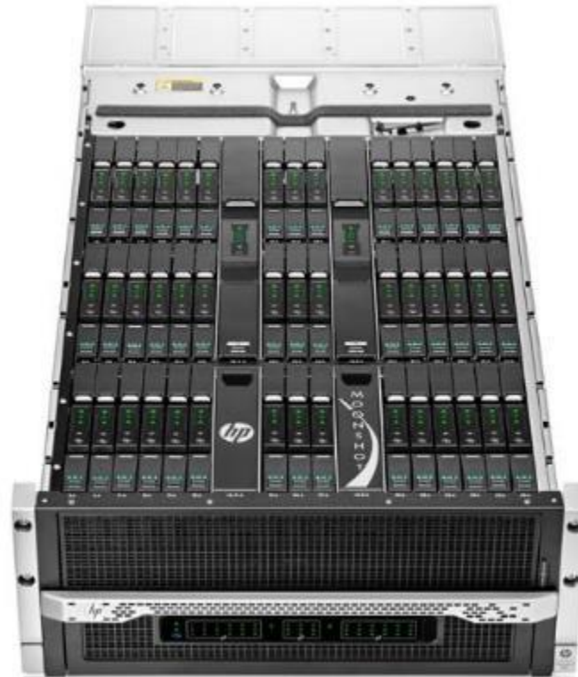
Moonshot 1500 Chassis