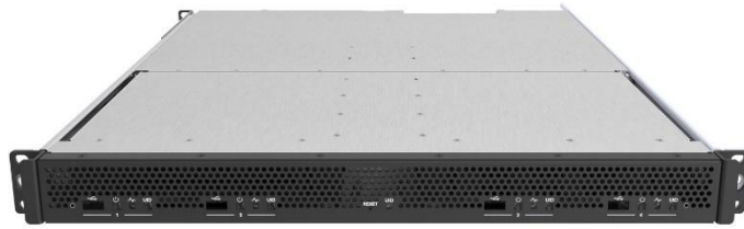
Edgeline 4000 Chassis